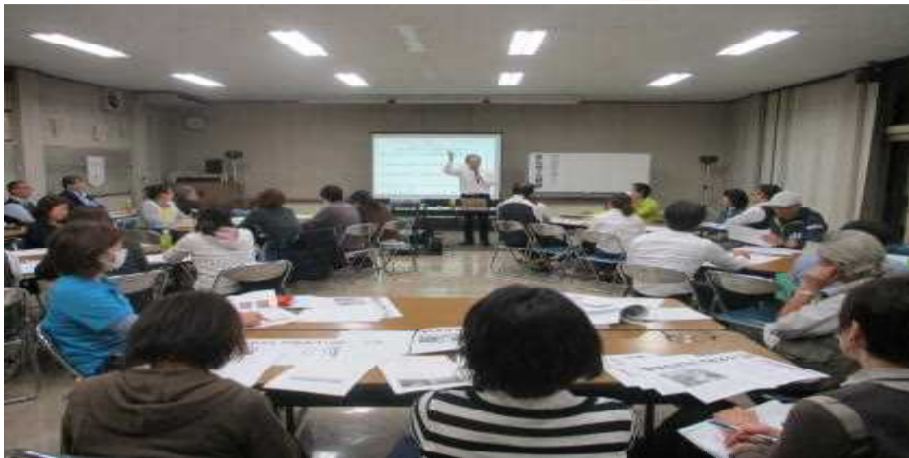
8月1日～10月5日まちゼミ研修会(延92名参加)