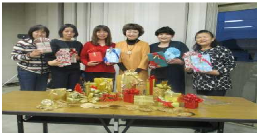
11月14日ラッピングセミナー(6名参加)