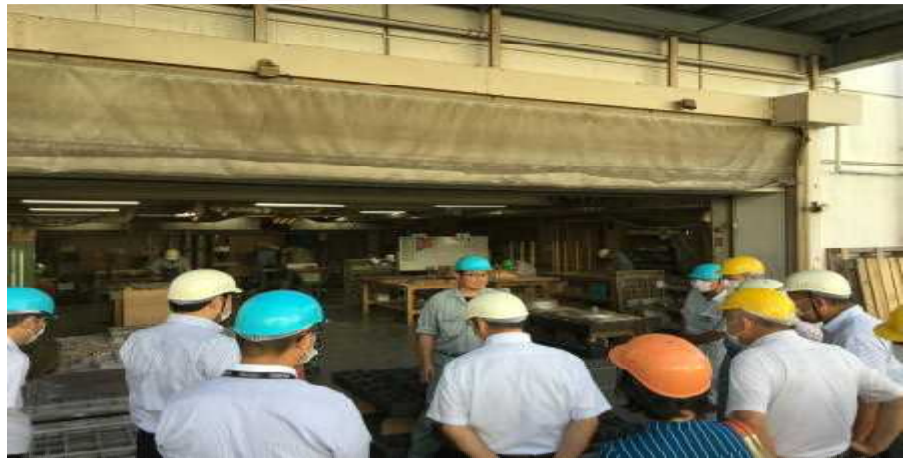
9月15・22日市内工場見学・交流会(延76名参加)