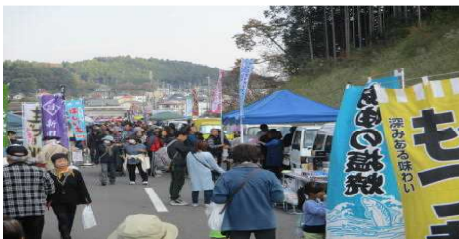
11月5日かたおか軽トラ市(来場者数15,000人)