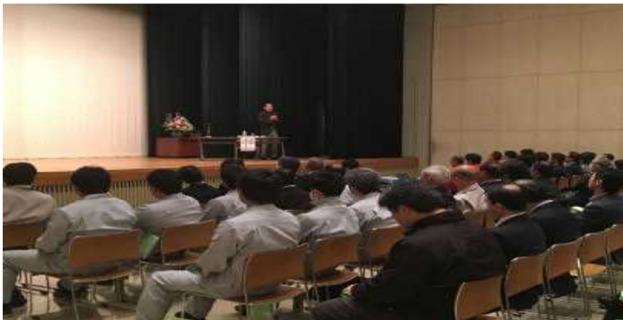
10月20日政経懇話会(130名参加)