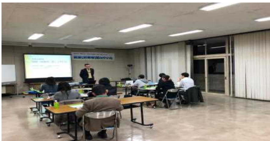
11月9日～12月7日創業塾inやいた(8名参加)