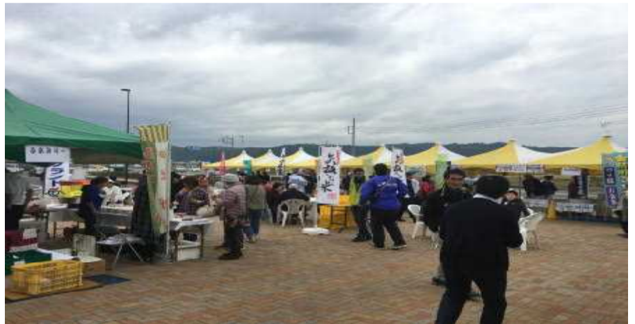
10月28・29日やいたブランドフェア(道の駅やいた/ブランドPR大盛況でした)