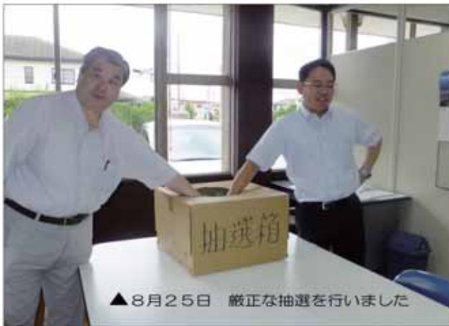
▲8月25日 厳正な抽選を行いました