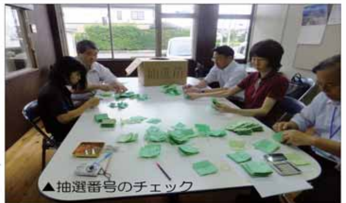
▲抽選番号のチェック

の窓口にて行ってください。お早めにご利用ください。 会に業務を委託し、発行したもので、市内での更なる消費喚起が期待されます。 発行しました商品券は、市内の二百五十七店舗で使用ができます。消費者の利用期限は、平成二十八年一月三日まで。 取扱店の商品券換金期間は、平成二十八年二月二十九日まで毎週・木(祝日・年末年始除く)商工会