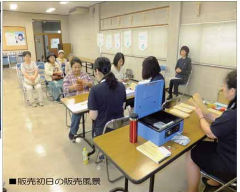
■販売初日の販売風景

一万円で二万二千円分の買い物ができる「つつじの郷やいたプレミアム付き共通商品券」の予約販売引換えが、九月一日から十一日にかけて行われました。購入希望者からの往復はがきによる申込みは、